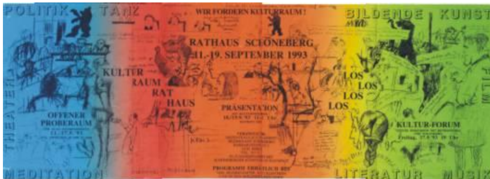
KULTURRAUMRATHAUS 11.-19. September 1993 eine Veranstaltung der Dezentralen Kulturarbeit in Zusammenarbeit mit Künstlern in Raumnot.

„ LebenSmittel “ ist ein Resultat der 1. Schöneberger Rathausaktion 1993 nach dem die Berliner Abgeordneten ins Parlament nach Berlin Mitte umzogen. KULTURRAUMRATHAUS war ein Gemeinschaftswerk der Dezentralen Kulturarbeit in Zusammenarbeit mit Künstlern in Raumnot in Berlin-Schöneberg. Danach war die Suche nach einen Rechtsmodell notwendig, ein Experiment des Vertrauens setzte ein, von dem man den Ausgang nicht voraussehen konnte.....doch er musste eingeläutet werden.